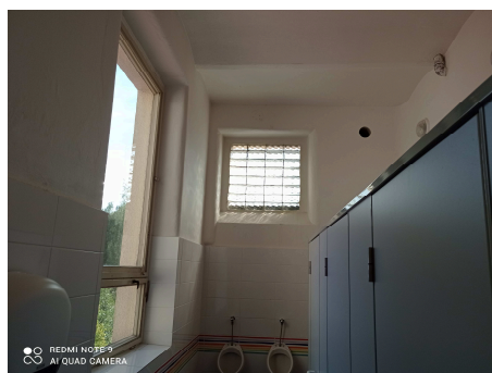
Okna W5 – vlevo rozšířit otvor , vpravo vybourat LUXFERY