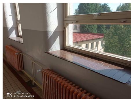
Zaoblené ostění u oken W4