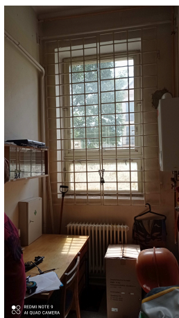
Vnitřní mříž (W12)